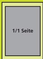
130 x 180 mm Euro 980,-