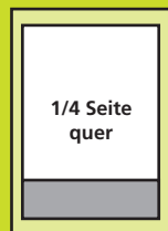
130 x 39 mm Euro 390,-

Umschlagseiten: 150 x 210 mm, U2/U3: Euro 1.150,- / U4: Euro 1.450,-