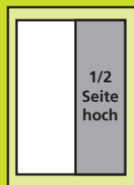
60 x 180 mm Euro 630,-